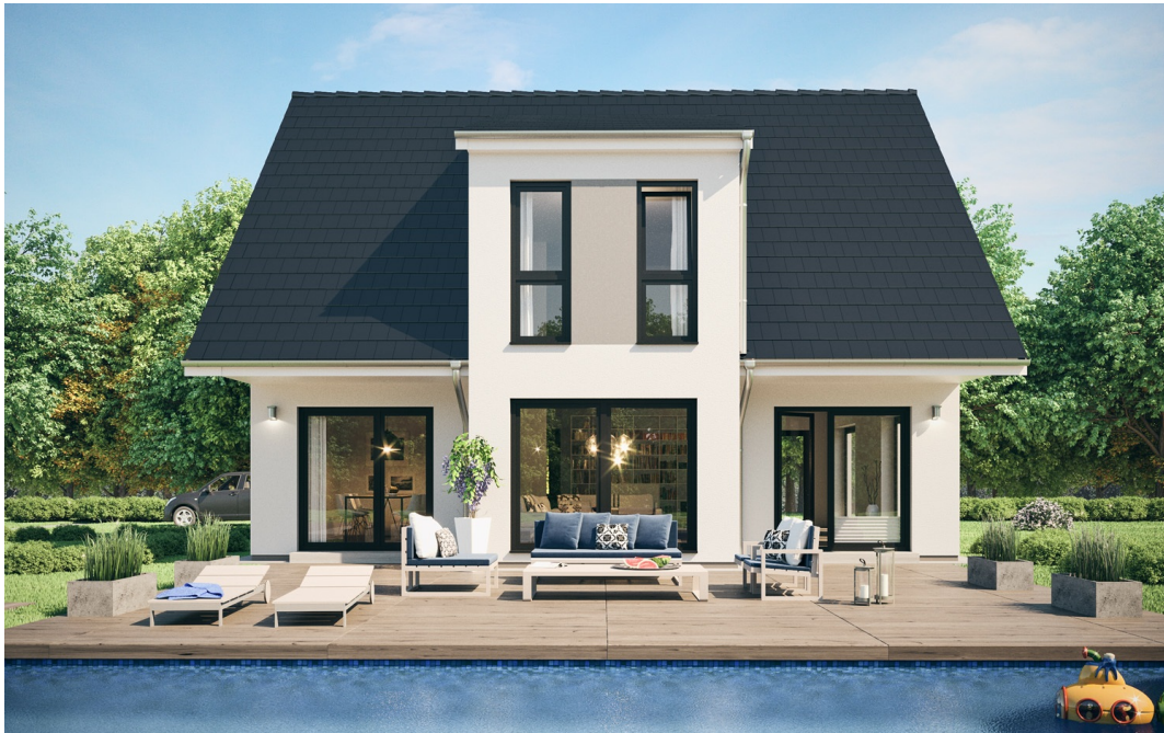
Fertighaus 1,5-Geschosser SH 150 FS

https://www.scanhaus.de/fertighaeuser/15-geschosser/-sh-150-fs