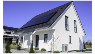
Fertighaus 1,5-Geschosser SH 150 FS Hauseingangsseite