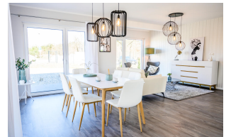
Fertighaus 1,5-Geschosser SH 150 FS Esszimmer