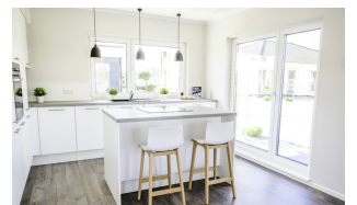
Fertighaus 1,5-Geschosser SH 150 FS Küche