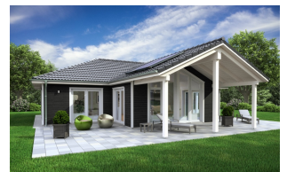
Fertighaus Bungalow SH 136 WB - Var. D1 mit überdachtem Freisitz