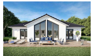
Fertighaus Bungalow SH 136 WB - Var. D1