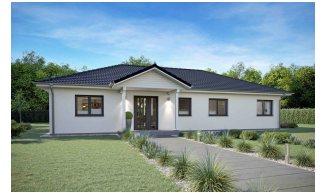
Fertighaus Bungalow SH 136 WB - Var. D2 Hauseingang