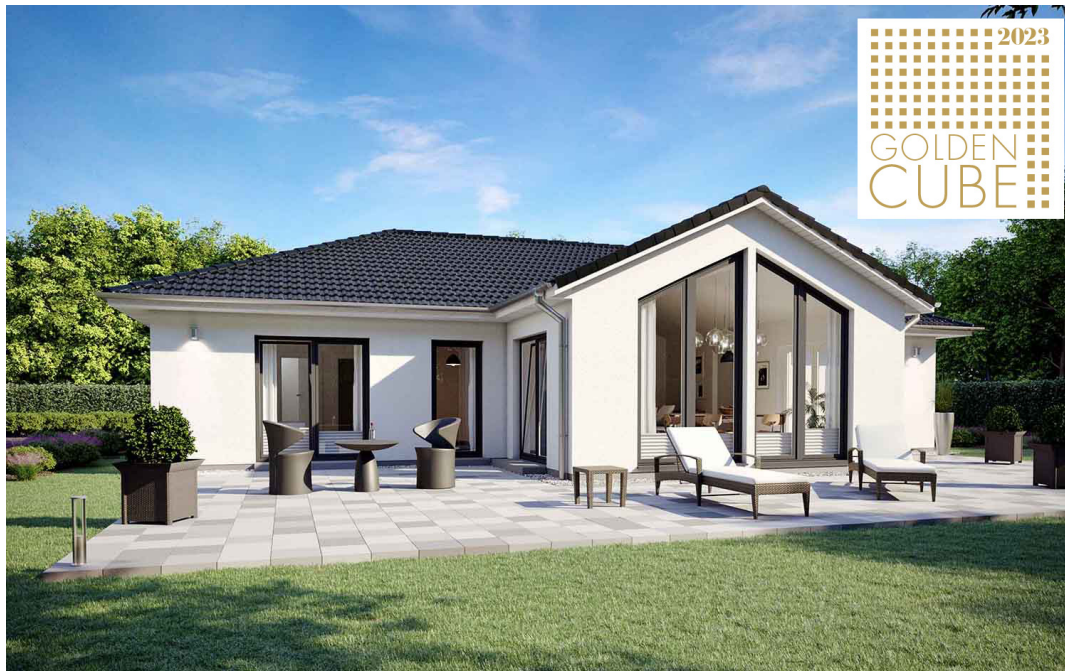
Fertighaus Bungalow SH 136 WB - Var. D2 und D3

https://www.scanhaus.de/fertighaeuser/bungalows/sh-136-wb-variante-d